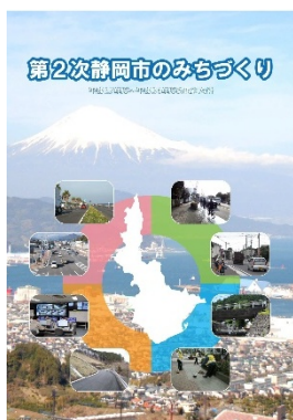
第2次静岡市のみちづくり （平成 27 年度～平成 34 年度）